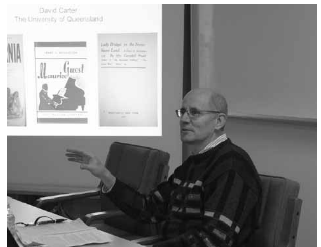
2014年1月28日CPASセミナーにて

上記の指摘は「オーストラリア作家とは誰か」や「オーストラリア作品とは何か」といった根源的な問題も提示する。カーター教授は、オーストラリア文学がアメリカで特に注目されたのは1930年代と1980年代であった一方、第二次世界大戦以降のアメリカではオーストラリア作品に対する関心が急速に減少したと説明する。ジャンル・フィクションとしての利益が優先された結果、オーストラリア作品の「オーストラリアらしさ」が影をひ