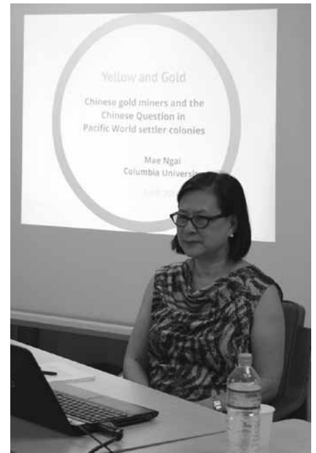
2014年6月10日CPASセミナーにて

ナイ教授によれば、中国人労働者と平和的に共存した白人労働者もいたが、ヨーロッパによるアジアの植民地化の影響を彼らの多くも受けていたことや、ネイティヴィズムが白人の権利を守り正当化するために有効な手段として働いたという事情があったため、中国人労働者は反外国人感情の標的になりやすかった。中国人自体の数は少なかったにもかかわらず、反中国人感情や暴力が起こった理由として、白人労働者が金の採掘権を独占するために中国人労働者を他者化し、その独占の正当化を主張したことにあるのではないかとナイ教授は述べた。教授によると、カリフォルニアでは1852年から反中国人感情が公に示されるようになり、中国人鉱夫の採掘を禁じるなどの規制が行われるようになったという。1853年には黒人奴隷貿易と中国人移民流入を同列に論じる言説が流布し、中国人労働者が非自由労働者として人種化されて