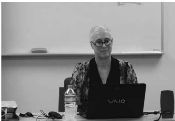
2014年5月19日CPASセミナーにて

The seminar began with Elder’s introduc-