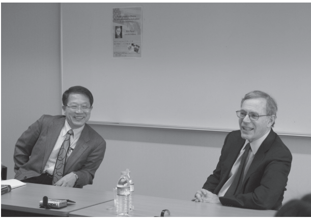
2009年3月16日CPASセミナーにて 左より古矢旬教授、エリック・フォーナー教授

Reconstruction did not fully succeed, however. Professor Foner stresses that the political revolution went forward during Reconstruction without being accompanied by an economic revolution. Eventually, without economic freedom, former slaves had no alternative but to go back to work on plantations. And what followed was a century of racial segregation, disenfranchisement, and many other inequalities imposed in the South and acquiesced to by the North.