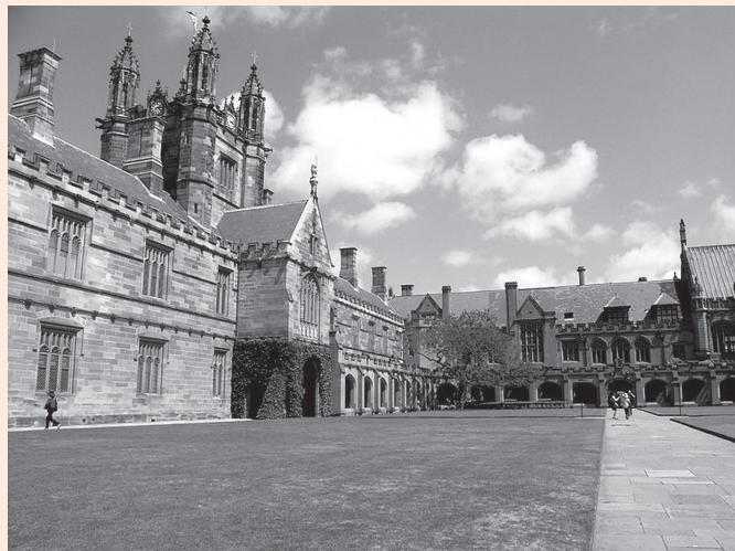
シドニー大学の中心をなす四角形の建物 (Main Quadrangle)

Australian tertiary sector. Arguably the loss to date has been primarily Australia's. Far too little has been done to foreground parallels, and learn from America's past and present experience. Nor have Australians, in sufficient numbers, been urged to avail themselves of America's outstanding tertiary institutions, or to undertake research in American Studies. What the Sydney centre will eventually 'mean' and achieve only its future practice will define. The challenges are daunting, the opportunities immense, the temptations to ideological bias and propaganda self-evident. To borrow Barack Obama's words to the 2009 commencement class at the University of Notre Dame, the Sydney University initiative comes of age at a moment of great consequence for the bilateral relationship, and it has a privilege and responsibility afforded few academic centres. Whether it will bring about a meaningful shift in Australian understanding of, and attitudes towards, the world's super-power, or its own version of an 'American Renaissance' Downunder, remains to be seen. But overseas academic institutions, with similar leadership aspirations in the field of American Studies, would be well advised to monitor its efforts, and to include this United States Study Centre in their global planning.