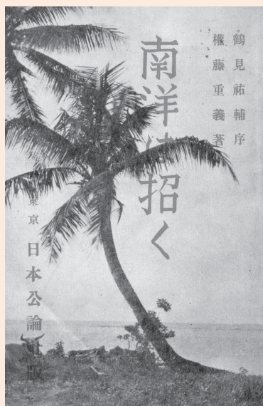
権藤重義「南洋は招く」(日本公論社版、1939年)

この科研プロジェクトは、アメリカ合衆国の世界戦略における文化外交の実態をその多元性、多層性において解明することを目的としている。昨年度は具体的な考察対象として、日本の旧南洋群島植民地であり、今日はアメリカの影響下にあるマリアナ諸島に焦点をあてた。三月にはカリフォルニア大学ロサンゼルス校のキース・カマチョ博士を東京に招聘し、日本、アメリカを含む統治時代の文化的遺産に関する