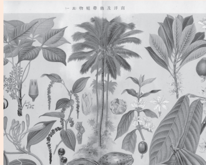
伊藤篤太郎撰「南洋及熱帯植物」(出版地/年不明)

子、南洋庁の役所の建物や南洋興発会社の立派な施設などを、「未発達」の「カナカ族」や「トラックの島民」の様子と対照させることで、日本の開発政策を視覚的に正当化していた。