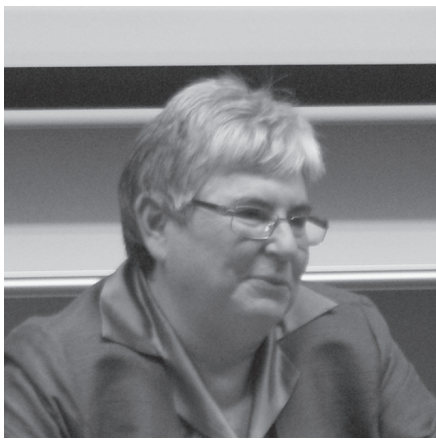
2009年1月27日CPASセミナーにて

あり、国際的であること。従来、史料を見るという行為は、それに時間とお金、労力を費やすことができる少数の者の特権だったのが、インターネットを通じて万人が史料にアクセスできるようになり、またその史料を解釈する機会も万人に提供された。その上、その解釈をウェブ上で公開すれば、社会知への貢献を実感ができるのがニュー・メディアであると話された。学生と教員との権力構造を観点に言えば、インターネットは、教員がエキスパートとして一人で資料分析をし、知を一方的に伝授するという形式から、学生が史料に触れ分析するのを手助けする教育法に変化させるものであると解説した。