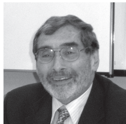
2009年6月3日CPASセミナーにて

2009年6月3日、ニューヨーク市立大学のフレッド・カプラン（Fred Kaplan）名誉教授が招かれ、“The Power of Words: The Oratory of Presidents Lincoln and Obama”と