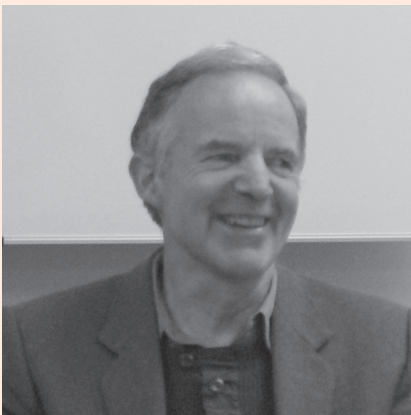
2009年4月30日CPASセミナーにて

(James Cook University/Visiting Professor from Australia, University of Tokyo)