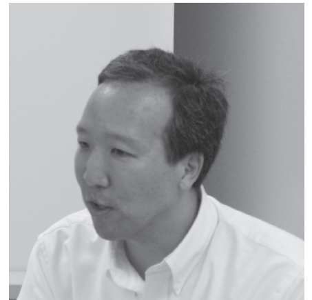
2009年7月6日CPASセミナーにて

准教授・東京大学大学院総合文化研究科客員教授であるロン・クラシゲ (Lon Kurashige) 氏により、“Japanese Immigrants and the Retreat from White Supremacy (日本人移民と白人優越主義の後退)”と題したセミナーが催された。日系アメリカ人史研究の第一人者であるクラシゲ氏は6月下旬に来日し、3週間にわたる集中講義を開講された。セミナー当日の午後には米国留学を志す大学院生を対象に、願書や申請書などの書き方についてのワークショップも開かれ、非常に得るものが多い初夏となった。