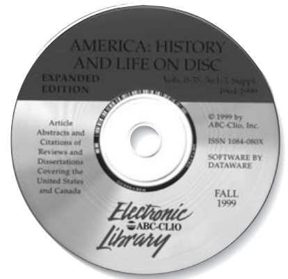
America: History and Life

CD-ROMやインターネットなどの電子メディアで提供される資料の検索用端末を、アメリカ研究資料センターは昨年リニューアルしました。また利用者の方からリクエストの多いCD-ROMについてはCD-ROMサーバーを導入することで貸借手続きを簡素化し、端末から直接閲覧できるようにしています。現在センターでは、30タイトルをこえるCD-ROMを所蔵していますが、今回、その所蔵CD-ROMを利用した情報検索について簡単にご紹介します。