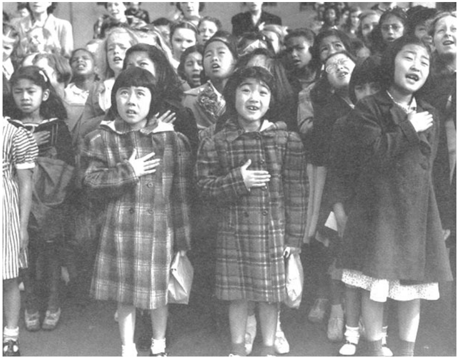
Dorothea Lange, One Nation Invisibile . San Francisco, 1942

ノムラ氏は、これまで比較的知られていない中西部に住む日系人の歴史を、一人でも多くの体験に基づき再構築しようと試みてきた。ノムラ氏の講演は、1997年から実施されているプロジェクトの経過報告であった。ノムラ氏は、700人近いアンケート調査の統計を基に、彼らが西海