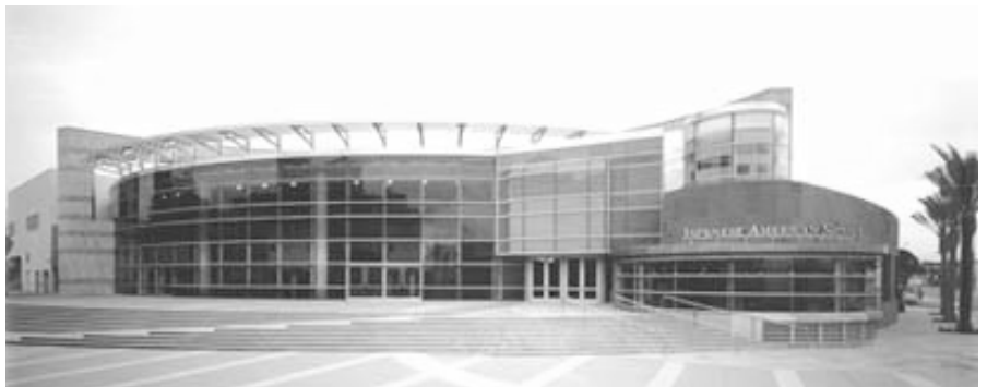
Japanese American National Museum