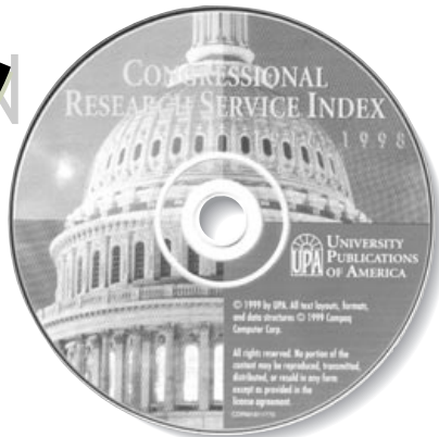
Congressional Research Service Index